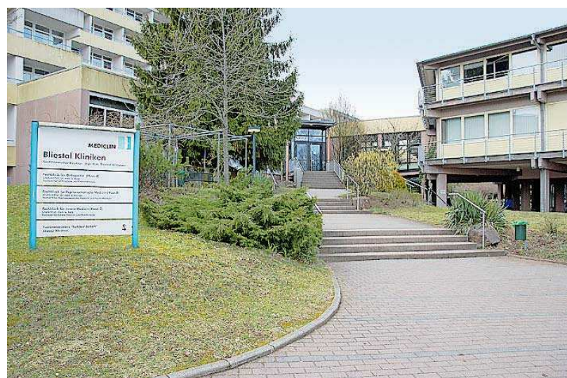
Die Blietal Kliniken waren Schauplatz der Fachtagung.