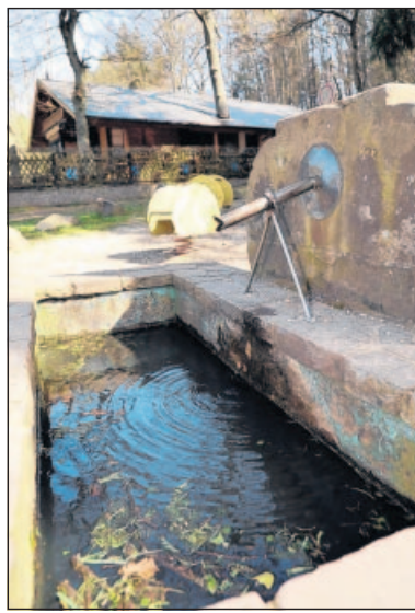
Aus dem einst so munter sprudelnden Brunnen an der Wanderhütte tröpfelt's nur noch.

Die reguläre Zufahrt zur Ski- und Wanderhütte in Schwarzenacker wird wegen der Bauarbeiten noch etwa zwei Wochen lang gesperrt bleiben. Umleitungen führen über den Ohligberg und über den Schlangenhöhler Weg zu den Tennisplätzen. „Für Lieferanten ist unsere Hütte aber gar nicht mehr erreichbar“, beklagte Schöbel und fragte daher im Ortsrat an, ob man denn nicht die alte Fußgängerbrücke über den Pfän-